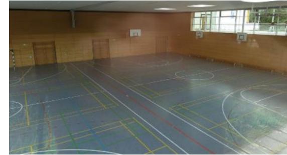
Die Sporthalle des Ammersee Gymnasiums (ASG) Dießener Str. 100.