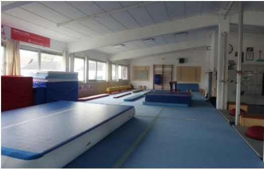
Unser Turn- und Bewegungszentrum (TBZ) Lachener-Straße 52