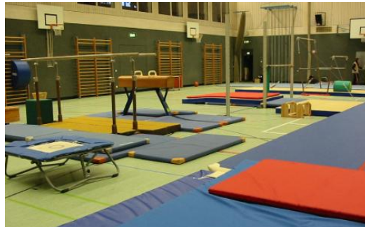
Die Mehrzweckhalle der Marktgemeinde Dießen (MZH) Baumschulweg

Die Unterstützung von Gewerbebetrieben in Dießen: